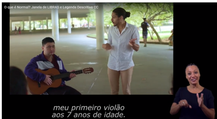
Figura 2 Exemplo de um vídeo acessível para discentes surdos ou com deficiência auditiva disponível no seguinte endereço do YouTube: https://www.youtube.com/watch?v=_Pvo-28LA7Bg ou clique na imagem para acessar o vídeo

comunidades surdas, oficialmente reconhecida a partir da Lei nº 10.436/2002 (BRASIL, 2002), que coadunam com a necessidade do discente. Nesse sentido, se faz necessário saber se o discente é usuário da Libras ou se prefere usar da Legenda em língua portuguesa. É relevante frisar que a utilização de apenas um recurso não elimina o outro, dessa forma, a sugestão é que se opte pela utilização dos dois recursos simultaneamente.